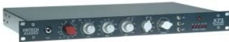
The Vintech Audio X73